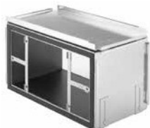
Caisson de distribution d'angle CW-D-420