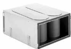
Caisson silencieux de répartition CW-S-420