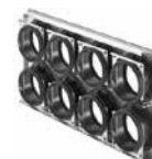
Plaque de raccordement pour ComfoTube CW-M-420