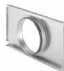
Plaque de raccordement arrière CW-P-420