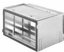
Caisson filtrant CW-F-420