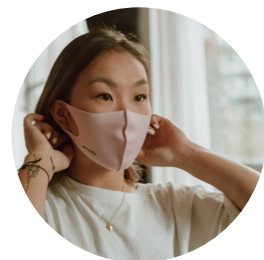
POLLUTION DE L'AIR INTÉRIEUR